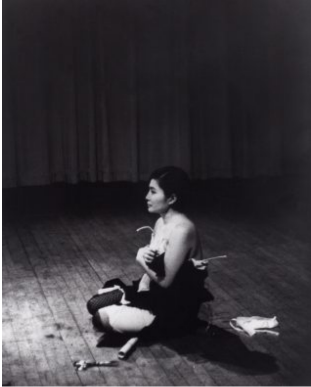
Sally Mann: Family Pictures